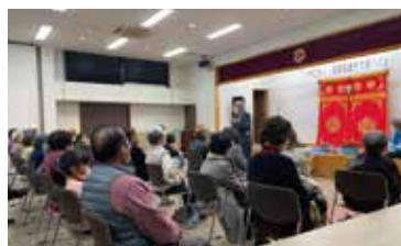
11月 笑って元気会「泉友愛クラブ」 (豊後大野市商工会館)