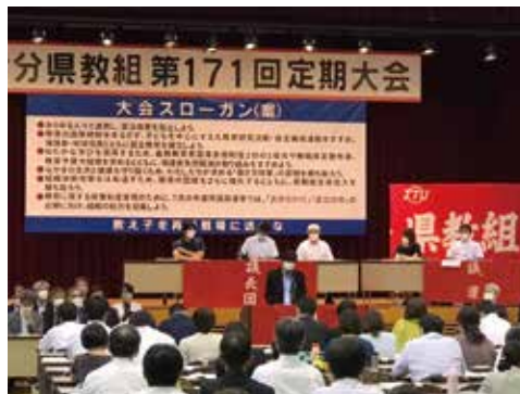
7月 県教組定期大会挨拶(県教育会館)