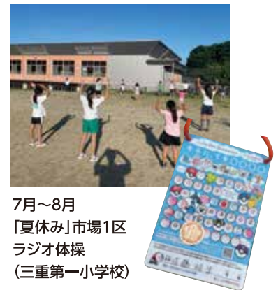
7月~8月 「夏休み」市場1区 ラジオ体操 (三重第一小学校)