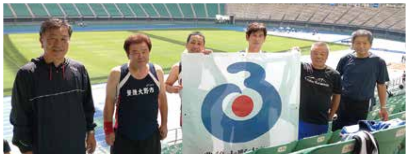
9月 県体:陸上議員リレー出場(昭和電工ドーム)