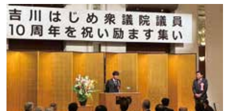
12月 吉川はじめ衆議院議員10周年挨拶 (ホテル日航大分オアシスタワー)