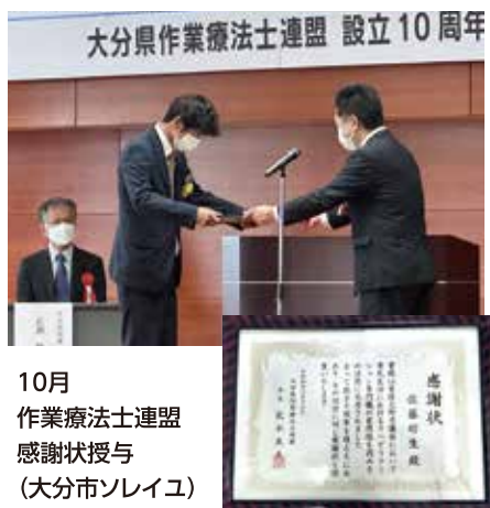
10月 作業療法士連盟 感謝状授与 (大分市ソレイユ)